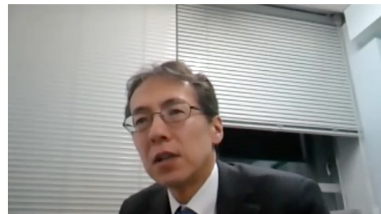
オンライン懇親会の様子